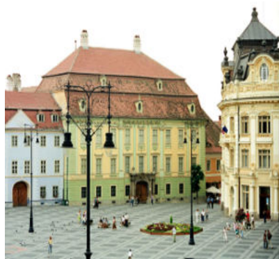
Muzeul Național Brukenthal -SIBIU