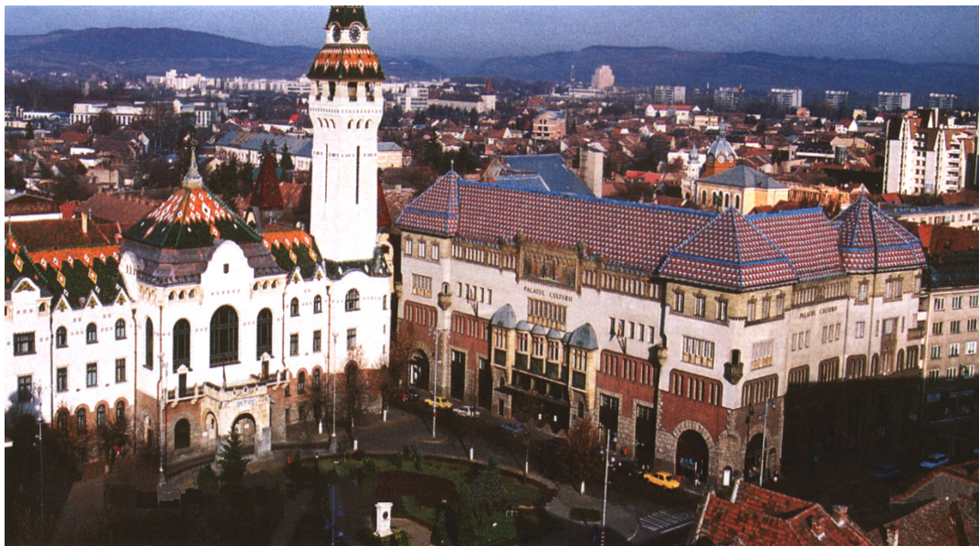
Târgu - Mureș (vedere generală)